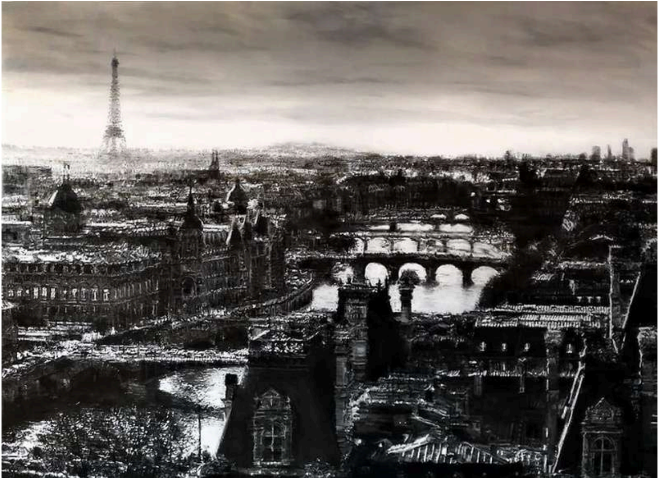
Paris Carbon 2018 olio su tavola / oil on board cm 160x220 € 22.800