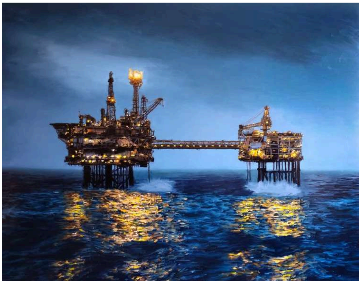
Platform 2024 olio su tavola / oil on board cm 140x180 € 19.200