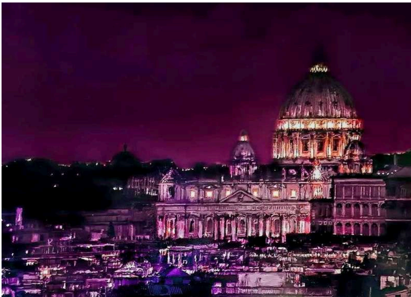
Roma 2018 olio su tavola / oil on board cm 115x160 € 16.500