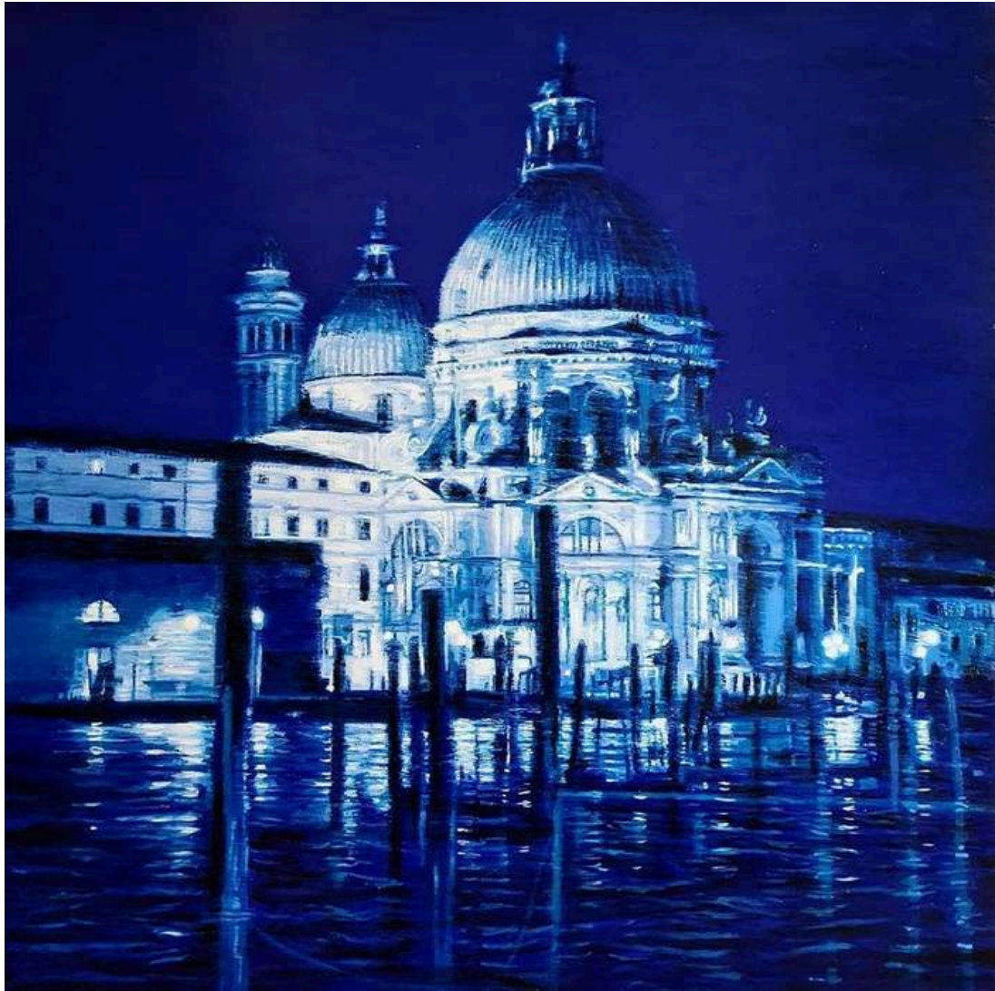
Venezia Blu. Chiesa della Salute 2023 olio su tavola / oil on board cm 100x100 € 12.000