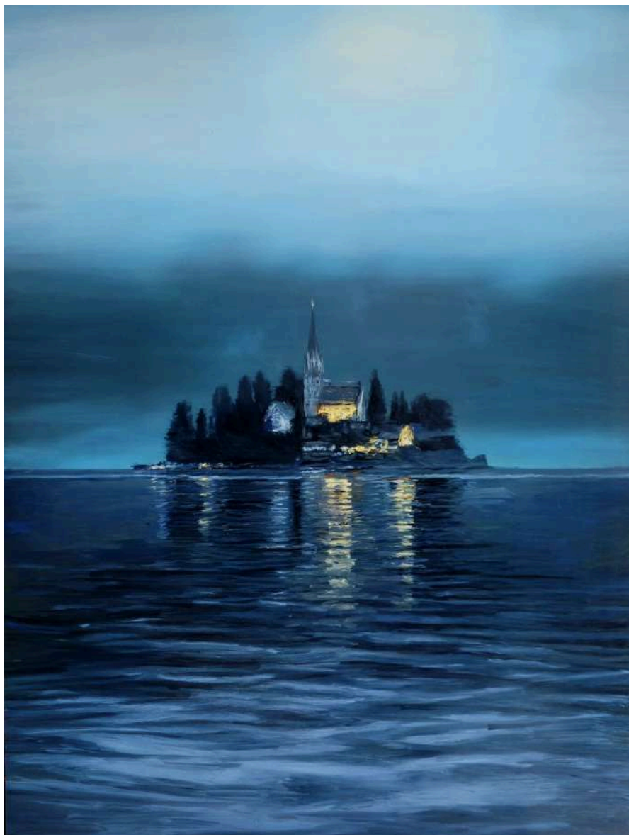
Studio per Lago D'Orta 2025 olio su tavola / oil on board cm 80x60 € 8.400