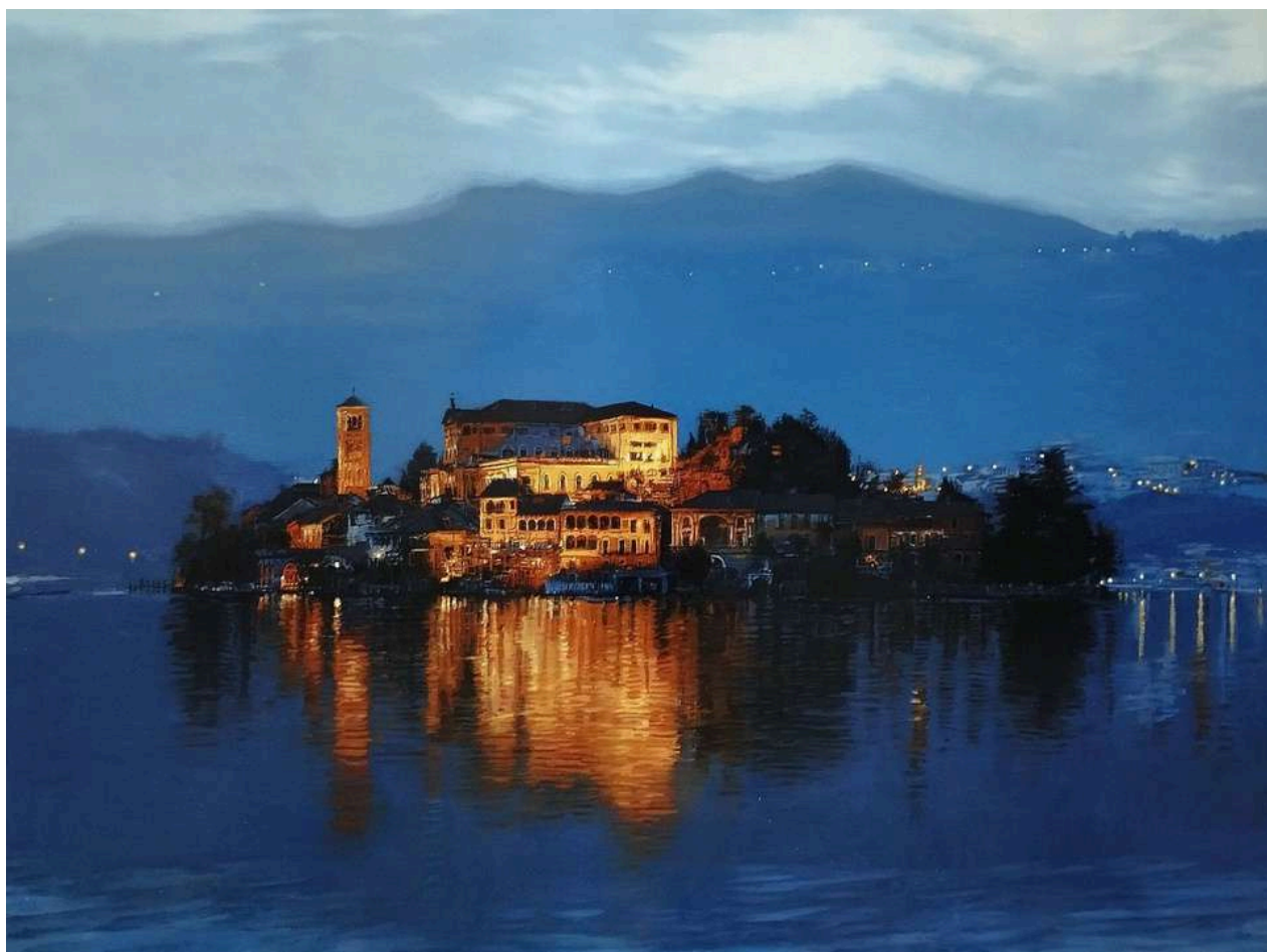
San Giulio 2024 olio su tavola / oil on board cm 150x200 € 21.000