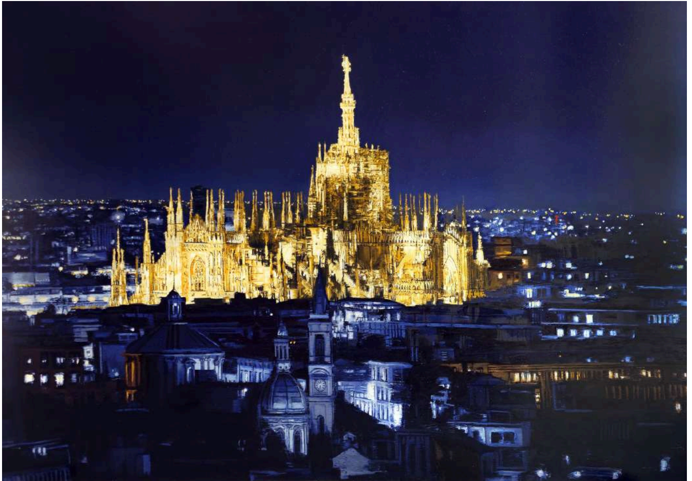
Duomo Blu 2025 olio su tavola / oil on board cm 140x200 € 20.400