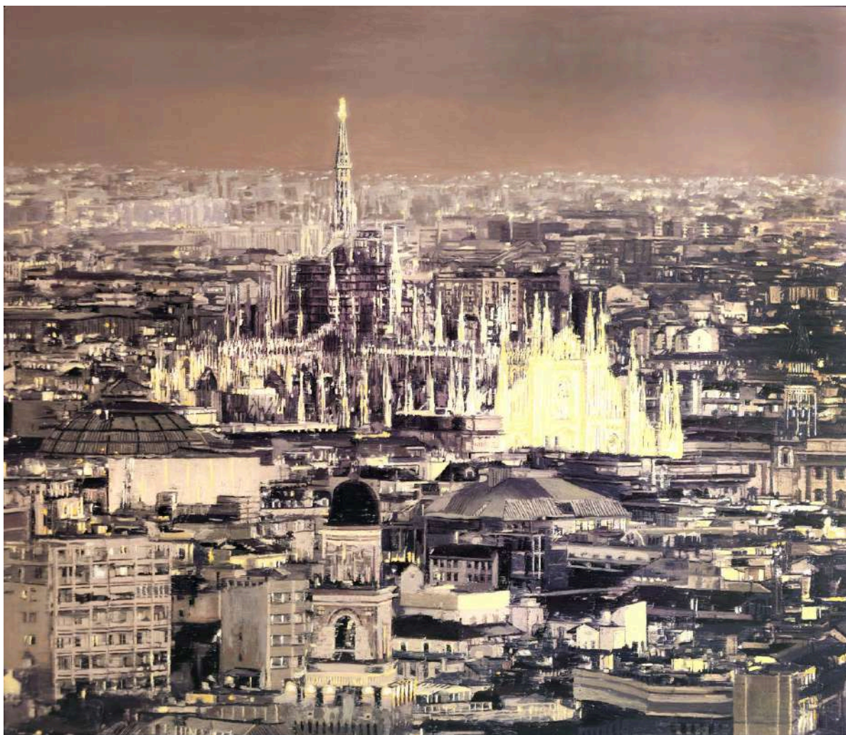
Duomo rosa 2025 olio su tavola / oil on board cm 130x150 € 16.800