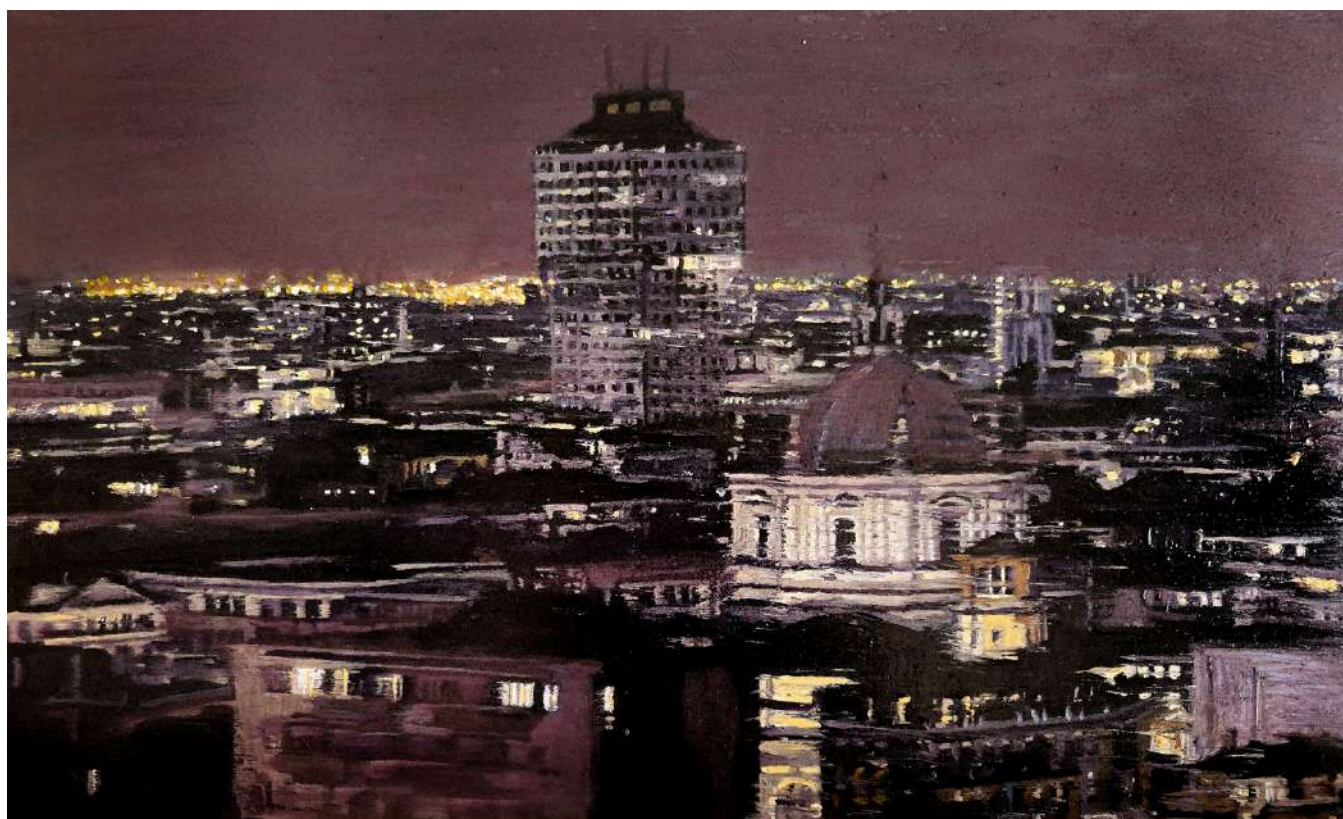
Piccola Milano 2025 olio su tavola / oil on board cm 30x50 € 4.800