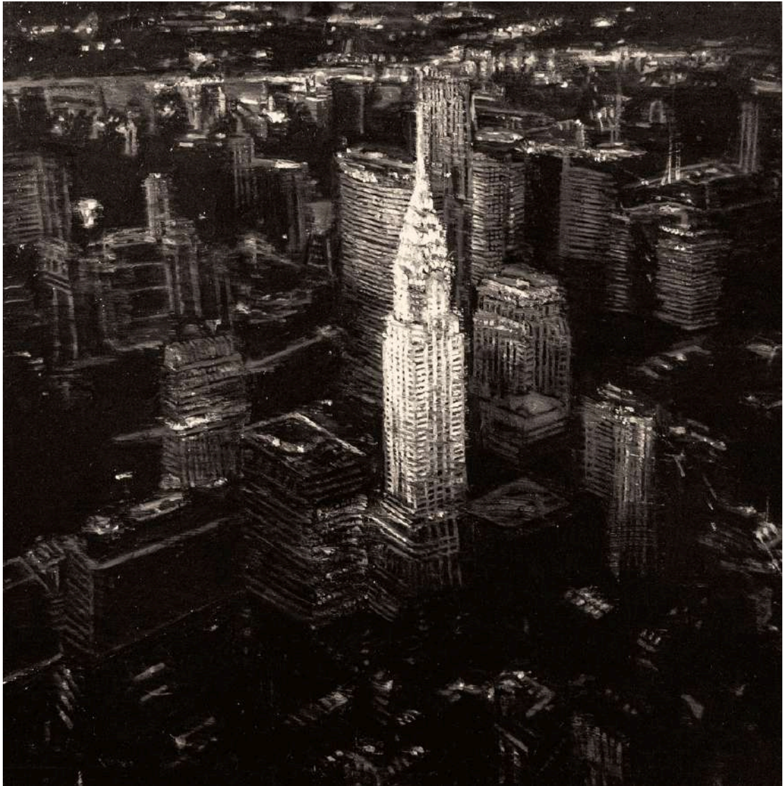
New York 2020 olio su tavola / oil on board cm 60x60 € 7.200