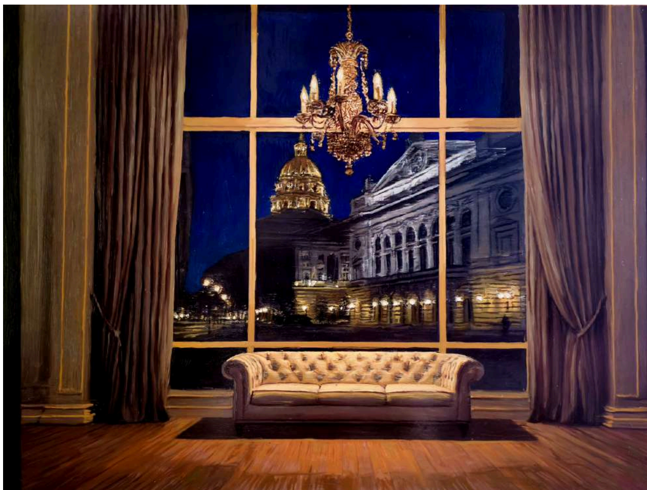
Studio per Milano 3 2025 olio su tavola / oil on board cm 60x80 € 8.400