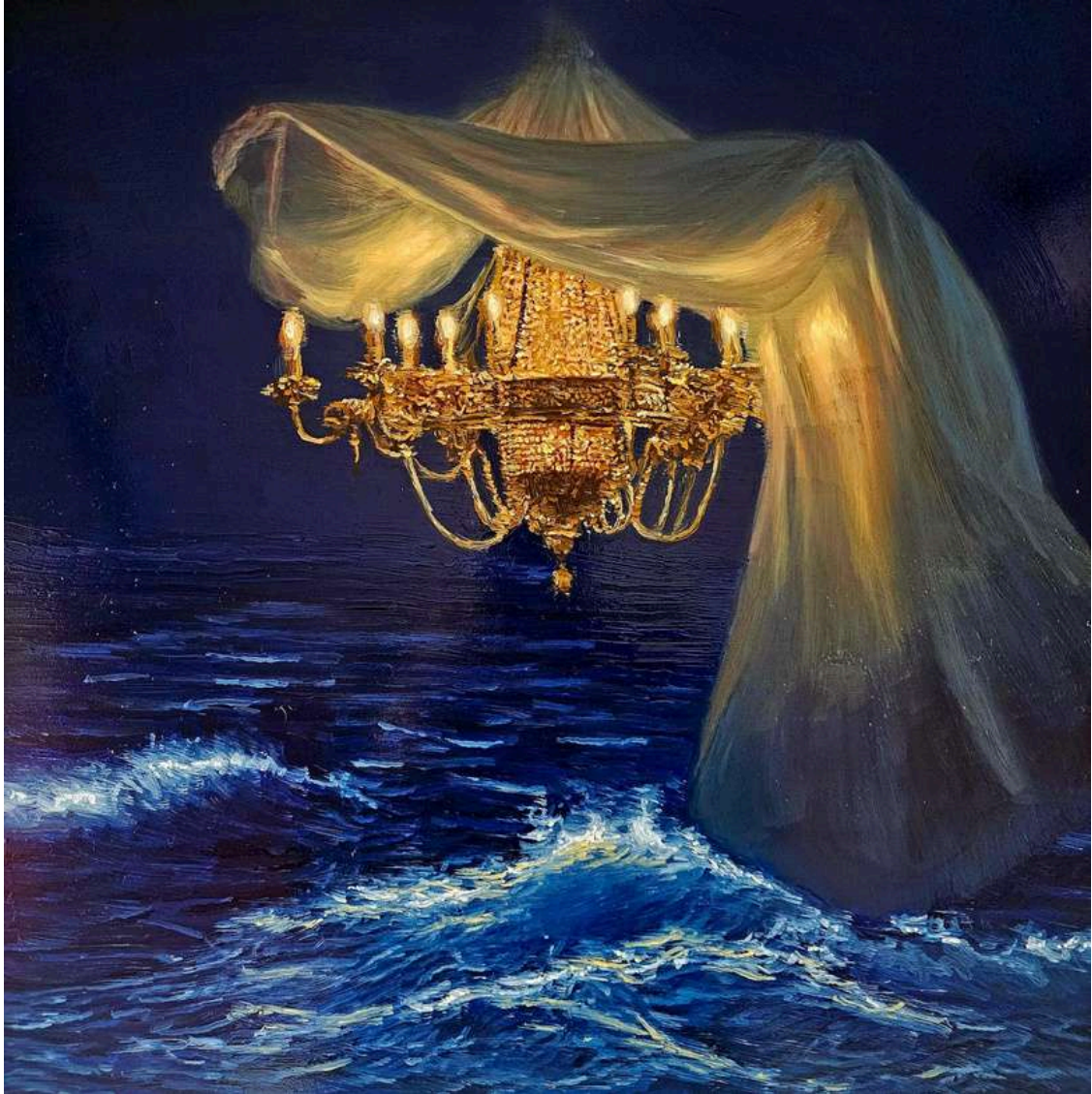
Lamp 2025 olio su tavola / oil on board cm 50x50 € 6.000