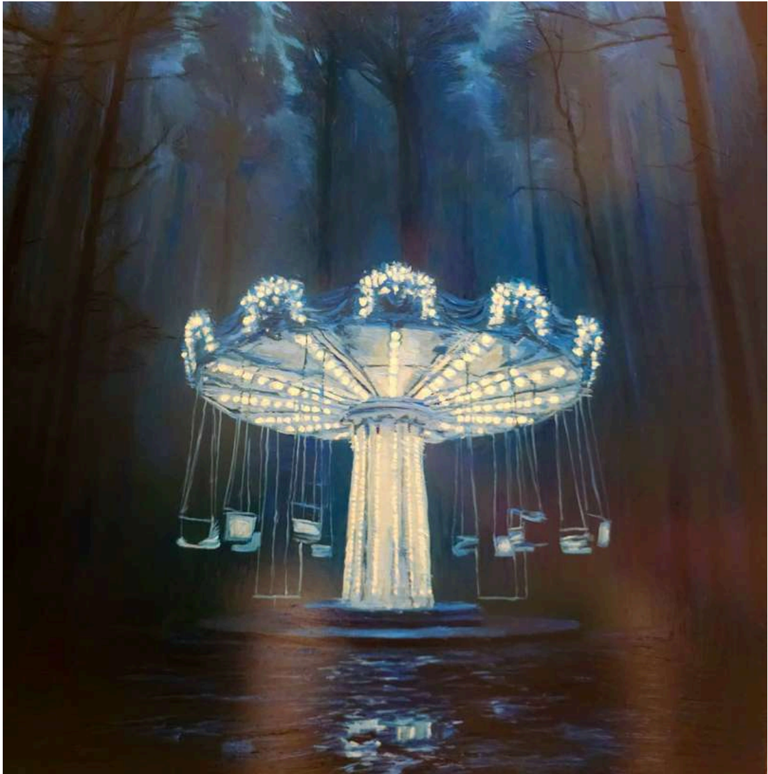
Giostra blu 2025 olio su tavola / oil on board cm 60x60 € 7.200