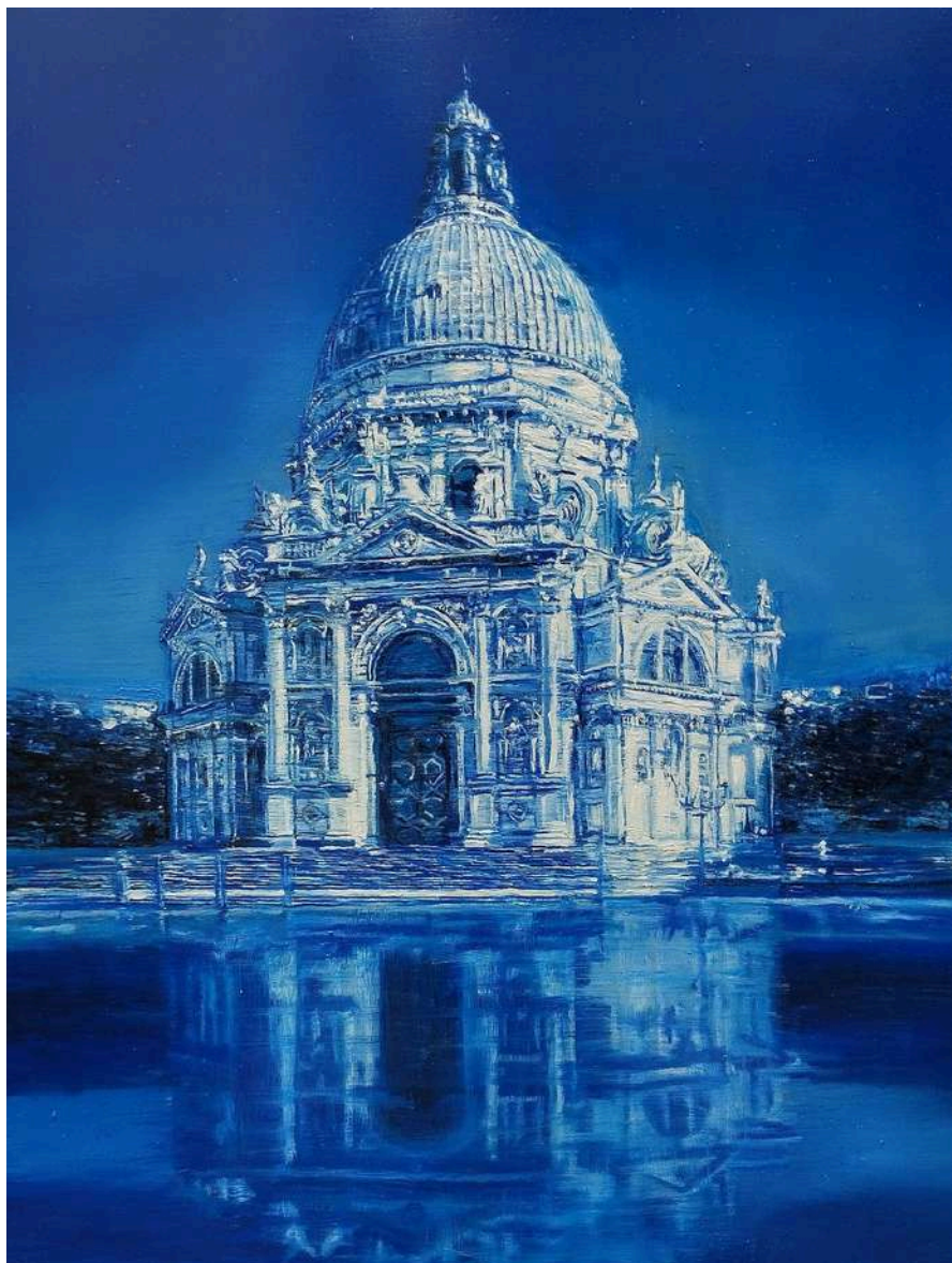
Venezia 2023 olio su tavola / oil on board cm 80x60 € 8.400