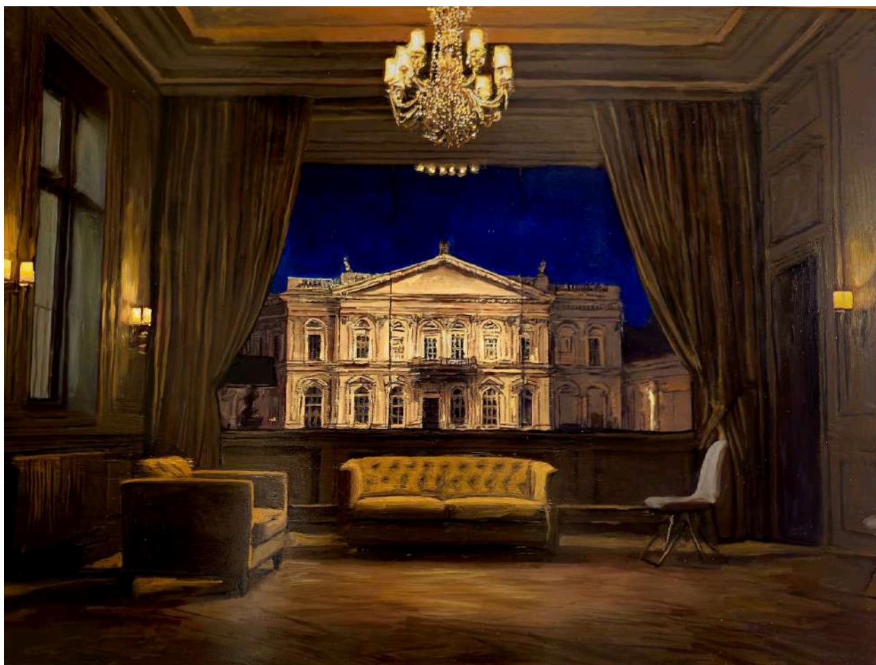
Studio per Milano 1 2025 olio su tavola / oil on board cm 60x80 € 8.400