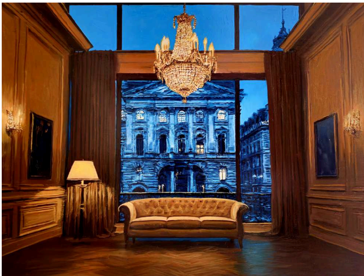
Studio per Milano 2 2025 olio su tavola / oil on board cm 60x80 € 8.400