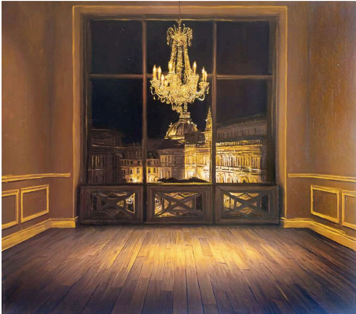
Interno Lamp 2025 olio su tavola / oil on board cm 90x100 € 11.400