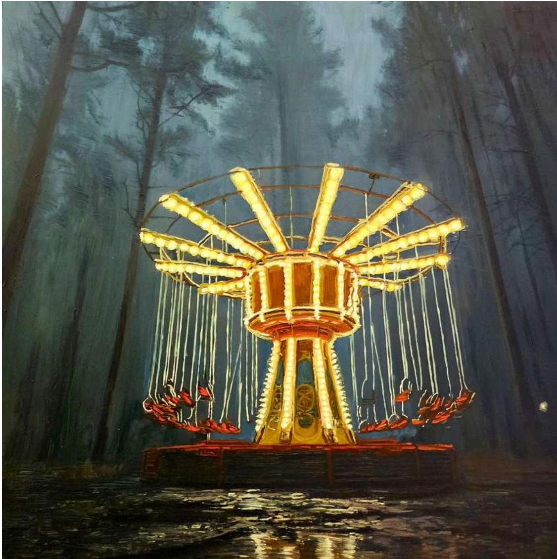
Giostra 2025 olio su tavola / oil on board cm 60x60 € 7.200