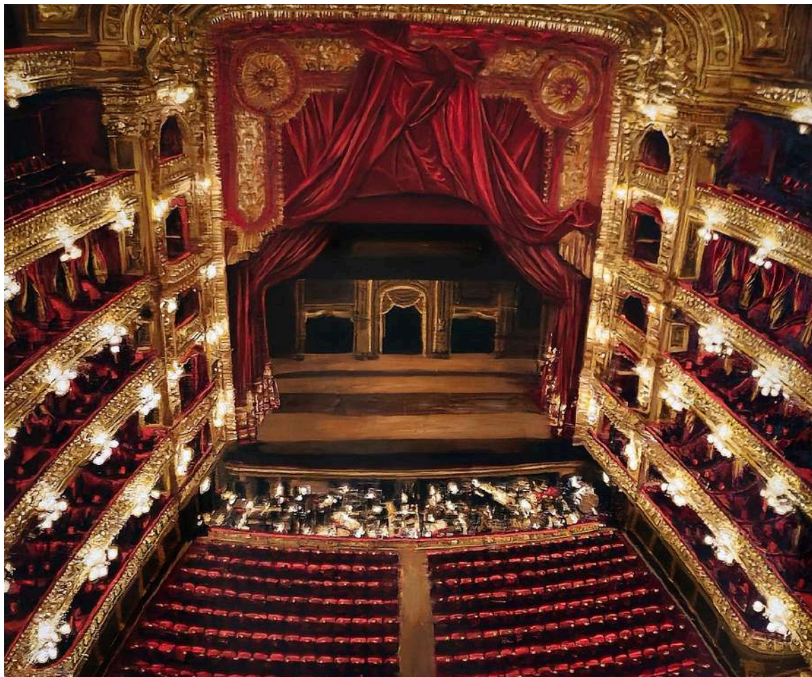
Colon 2024 olio su tavola / oil on board cm 150x185 € 20.100