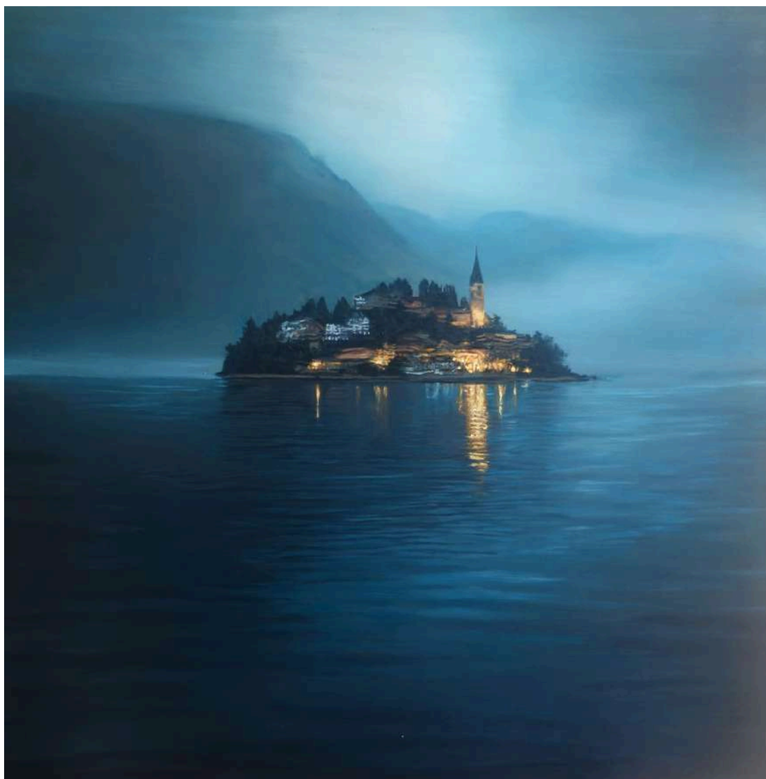
Studio per Lago D'Orta 2025 olio su tavola / oil on board cm 60x60 € 7.200